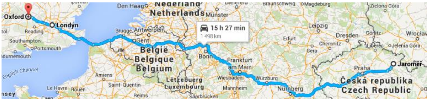
Výlet do Stratfordu upon Avon

Cesta z Jaroměře do Oxfordu se zastávkou v Londýně a zpět.